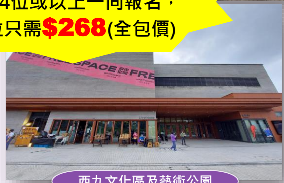
西九文化區及藝術公園