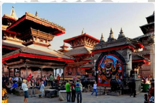
加德滿都杜巴广场