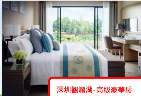
深圳觀瀾湖-高級豪華房