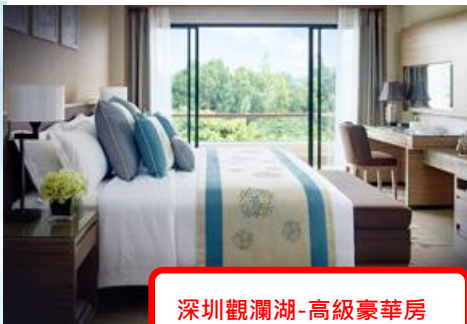
深圳觀瀾湖-高級豪華房