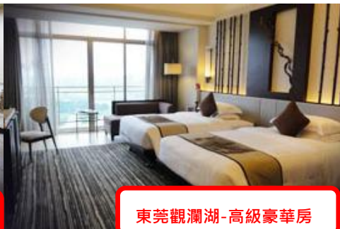
東莞觀瀾湖-高級豪華房